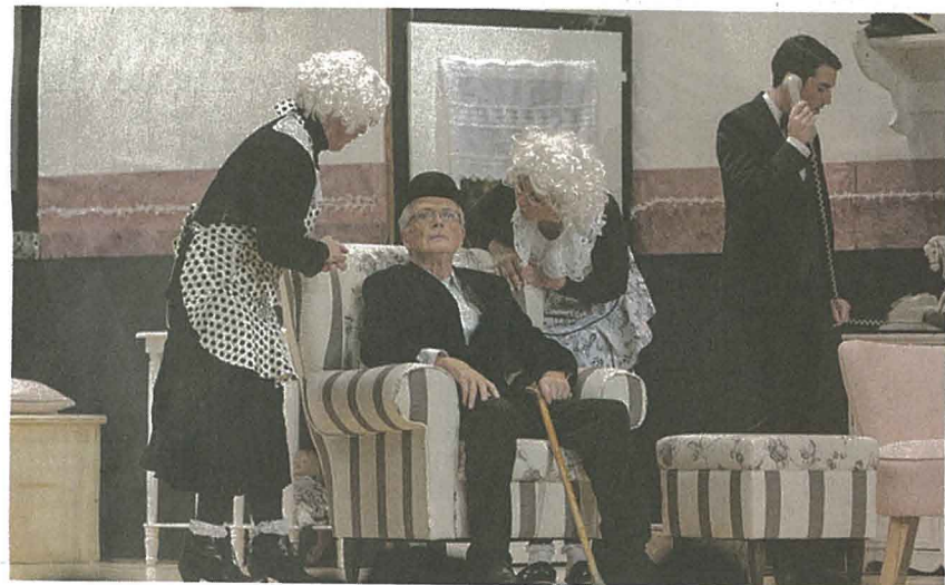
Abby und Martha Brewster glauben ihr nächstes Opfer gefunden zu haben, dem sie wohlwollend ihren Giftcocktail verabreichen wollen.

HILDISRIEDEN THEATERVEREIN AUF NEUEN WEGEN MIT LITERATURKLASSIKER «ARSEN UND SPITZENHÄUBCHEN»