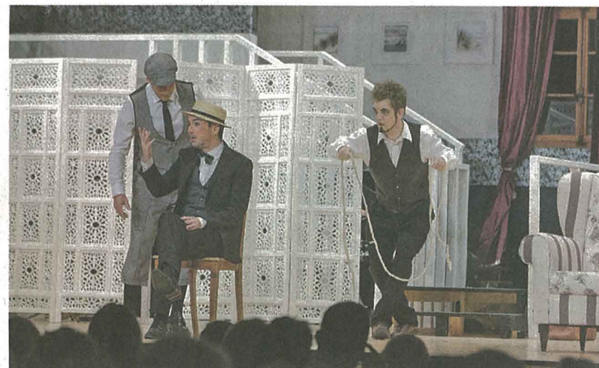
Mortimer Brewster (Mitte) ist sich keiner Gefahr bewusst, als er seinem kriminellen Bruder und dessen Gehilfen von einem Theaterstück erzählt.

Zum ersten Mal agierte der Theaterverein Hildisrieden als eigenständiger Verein und wagte sich an einen Klassiker. «Arsen und Spitzenhäubchen» wusste zu gefallen und läutete eine neue Ära für die Theatergesellschaft ein.